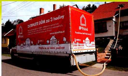
Automobil přijede přímo před dům se sedlovou střechou.