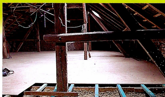
Do nové stropní konstrukce byla aplikována izolace a je montována dokonale rovná nová podlaha z desek.