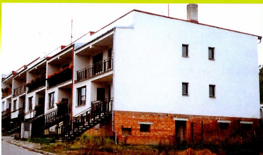
Pultová střecha – v létě vedro, v zimě zima.