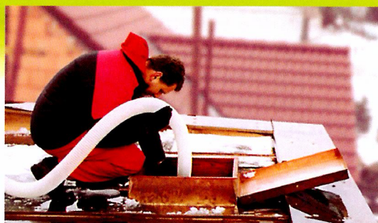
U pultových střech doporučujeme vždy osadit vikýř, je výhodný pro samotnou izolaci a jako revizní vstup do prostoru střechy.