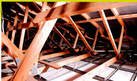
Závěsný strop je neúnosný a je zavěšený táhly. Pod dřevěným vazníkem je volný prostor, který je třeba vyplnit izolací.