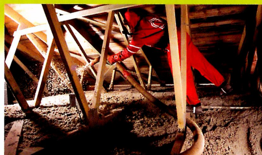
Neúnosný pohled vyžaduje opatrnost. Provedení finální vrstvy a vyrovnání na požadovanou výšku izolace.