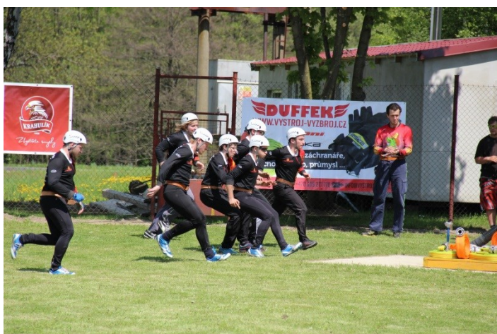
16.5. Kaliště – Memoriál Františka Pizy (neúspěšný pokus)

Je za námi téměř polovina soutěžní sezóny 2015. Náš tým absolvoval k 13. červnu celkem 8 soutěží na místech více či méně známých. Hlavní ligou, kterou již třetím rokem jezdíme, je Pelhřimovská liga v požárním útoku (PLPÚ). Během května se uskutečnila tři kola tohoto seriálu a pro náš tým neskončilo ani jedno kolo příliš dobře. V Markvarci na prvním kole jsme předvedli podprůměrný čas a skončili na 12. místě. Čtrnáct dní na to, 16. května na domácí trati, jsme propadli úplně a útok nedokončili. Do třetice na třetím kole v Bohdalíně jsme se nezlepšili a jen díky neúspěšným útokům ostatních týmu jsme brali body za 13. místo. Ještě ovšem zbývá 7 kol na to, abychom se ukázali a zabojovali minimálně o umístění do první desítky, které se nám vždy povedlo dosáhnout.