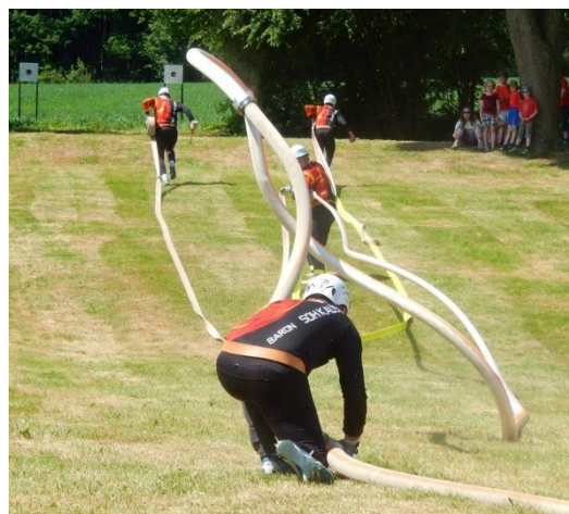
6.6. Nová Ves – Krpál – 1. místo!

Mimo PLPÚ jsme navštívili především okolní soutěže. Vůbec první soutěží v roce 2015 pro nás byla tradičně ta Velikonoční ve Zdešově na začátku dubna. Start sezóny nebyl špatný a skončili jsme sedmnáctí z celkem jednapadesáti týmů, které do Zdešova dorazily. Poslední víkend v květnu jsme se umístili na druhém místě v Panských Dubenkách. Na tuto soutěž jsme přejížděli z Bohdalína a právě na Poháru Soptíka, jak se soutěž v Panských Dubenkách nazývá, jsme odstartovali minisérii pódiových umístění. V sousední Nové Vsi o týden později jsme totiž získali svůj letošní premiérový triumf. Ukázali jsme výbornou sebranost týmu a dobře zvolenou taktiku v netradičních podmínkách. Úspěšný den jsme završili na noční soutěži v Horních Němčicích. Soutěž zařazená do Jindřichohradecké hasičské ligy se běžela ve stylu rozhazování a tento styl jsme naposledy běželi před téměř deseti měsíci. Ukázali jsme ale, že i bez tréninku jsme rozhazování nezapomněli a v konkurenci týmů specializujících se na tento styl jsme dokončili na úžasném třetím místě. Zlepšující se formu týmu jsme chtěli potvrdit i další víkend. Vydali jsme se do Chrbonína na Tábořsku, kde se dlouho zdálo, že budeme sahat po osobním rekordu. To se nepovedlo, ale věříme, že v nejbližších týdnech své rekordy vylepšíme. První šanci máme už v sobotu 20. 6. Na noční soutěži v Kamenici nad Lipou, která je nám ale zakletá a ještě se nám zde nikdy nepovedlo doběhnout. Držte nám proto palce!