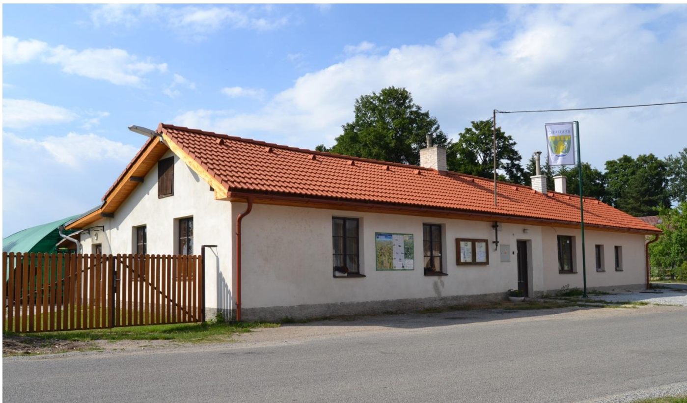
Text a foto: Jindra Kučerová