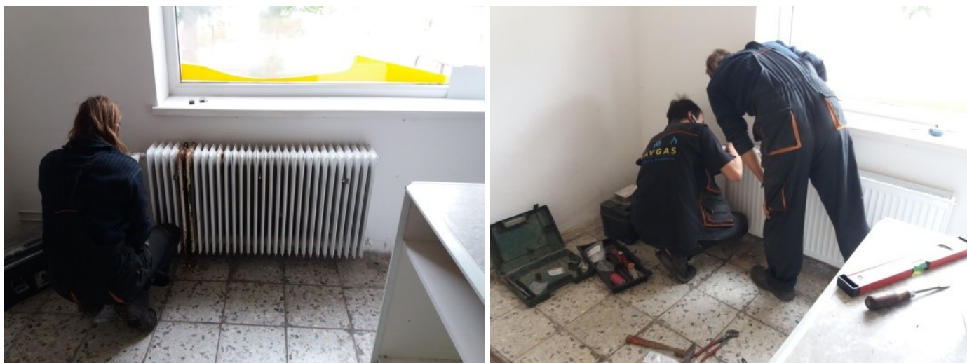
výměna prasklého radiátoru v nyní prázdné prodejně

Pokud se nám nepodaří uzavřít nájemní smlouvu s vhodným nájemcem, zůstává ve hře možnost provozování prodejny samotnou obcí. Doufám, že se nám podaří brzy obnovit provoz prodejny v naší obci a že v ní budete opět rádi nakupovat.